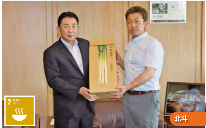
池田市長(左)に長ねぎを寄贈する山上組合長(右)