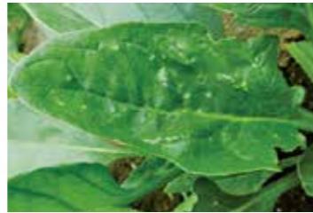
被害葉（コブ状の小突起）

その後、葉の生育に従い、縮葉やコブ状の小突起などの奇形葉になる。 被害葉を確認してからの防除は効果が低い。