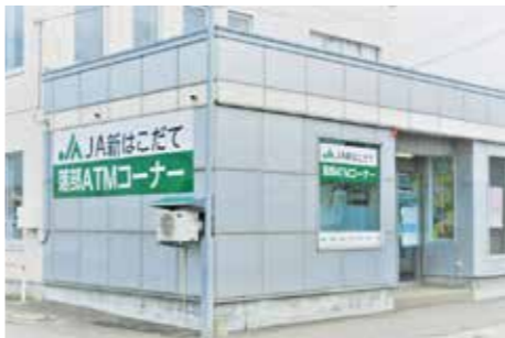
※落部支店の旧資材店舗内へ設置

この度、当JA落部支店・濁川事業所店内にATM(現金自動預払機)を設置いたしました。振込なども簡単にできますので、ぜひこの機会にご利用下さい。キャッシュカードのお申し込みやご利用方法など、ご不明な点は金融窓口までお問い合わせ下さい。