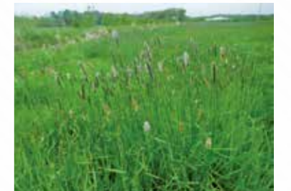
SVGとMFTが混在している (令和2年5月18日 七飯町)