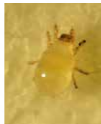
ホウレンソウケナガコナダニ

低温・高湿度を好み、 乾燥を嫌う 。高温期には発生が少ない。土壤表面が乾燥すると水分を求めてほうれんそうへ移動し加害する。