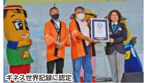
ギネス世界記録に認定