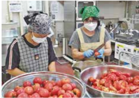
洗った大量のトマトを切る女性部員ら

北斗市女性部は7月4日から8月3日までのうち全9回、同市トマト共選場調理室にてトマトジュース作りを行った。