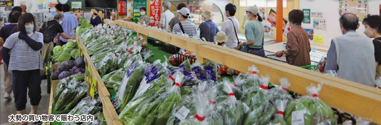
大勢の買い物客で賑わう店内