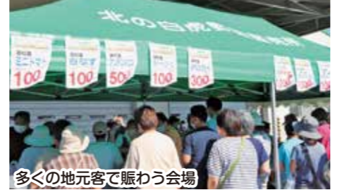
多くの地元客で賑わう会場