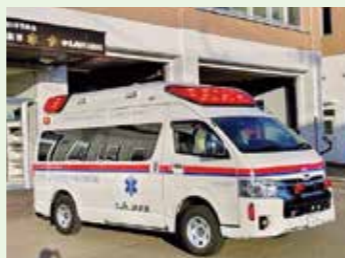
(写真は、昨年度実績です)

今後も行政とJAとの連携を図りながら、組合員ならびに地域住民に安全・安心を提供し続けるよう努力してまいります。