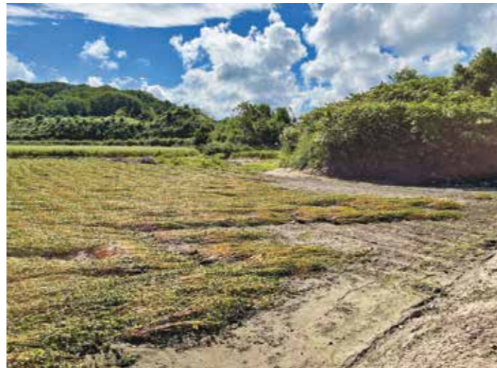
河川氾濫により倒伏したソバ(上)と泥を被ったブロッコリー(左)