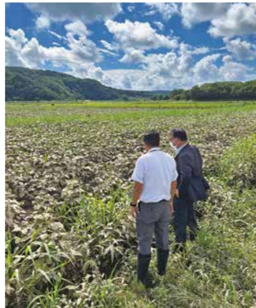
泥を被った大豆の様子