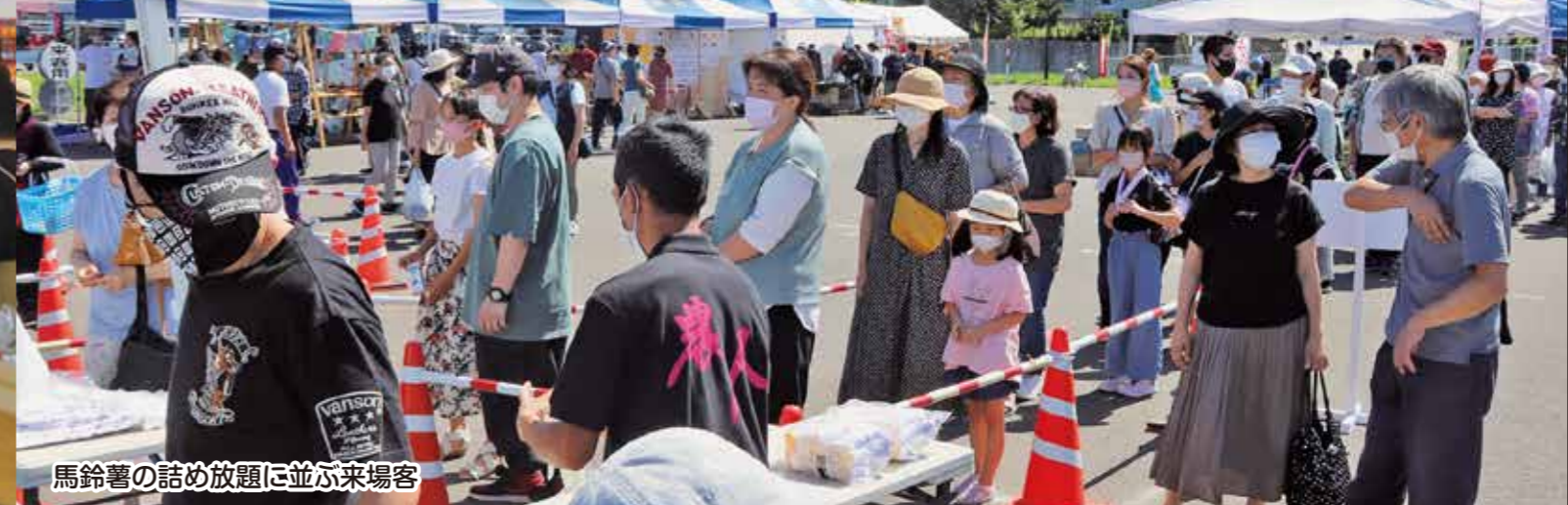
馬鈴薯の詰め放題に並ぶ来場客

「あぐりへい屋」は8月11日「お客様感謝祭」を開催し、当日はおよそ1500人が来場。店内には新鮮な野菜や果実などが並び、大勢の買い物客がカゴいっぱいを目当ての品を入れて買い物を楽しみました。屋外ではスイートコーンを特別価格で販売し、フードコーナーでは北斗市の地場産和牛「おぐにビーフ」や北斗市の人気飲食店、キッチンカーなどが出店し人気を集めました。また、子ども向けに縁日コーナーやスイカ割りコーナーも設けられ、家族連れの買い物客で賑わいました。