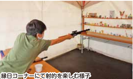
縁日コーナーにて射的を楽しむ様子