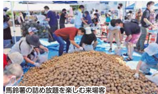
馬鈴薯の詰め放題を楽しむ来場客