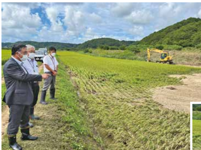
堤防決壊により土砂が流入した様子