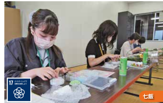
アロマワックスサシェの制作に励む職員ら

<注意点> 砂礫層や5cm超の石礫や埋木がある場合は施工できない場合があります。また、土性が壤土・砂壤土と粗くなるに従い空洞は崩れやすくなります。