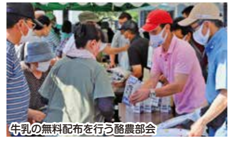
牛乳の無料配布を行う酪農部会

若松基幹支店は8月12日、同支店に併設する北の白虎ライスターミナル前広場にて「北の白虎【青空市】」を開催し、当日は販売開始時間の前から多くの地元住民が訪れました。本即売会には、海洋深層水を使用して栽培した「せたな町産潮トマト」や若松産の「男爵・きたあかり」など多数の新鮮野菜、また、せたな町のブランド豚「若松ポークマン」を当日限りの超特価で販売。またこの催しに併せて、せたな町水稲部会による「せたな町産ふっくりんこ」の増量特価販売や、せたな地区酪農部会による来場客全員への牛乳1ℓパックの無料配布が行われ、共に消費拡大への協力を呼び掛けました。