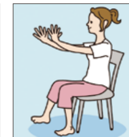
(4) (1)に戻ってからパーのポーズを取ります。パーは手足の両指を広げながら足も広げます。(1)から(4)までの動きを5~10秒ぐらいでできるようにするまで繰り返し練習しましょう。