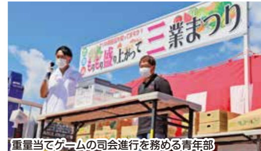
重量当てゲームの司会進行を務める青年部