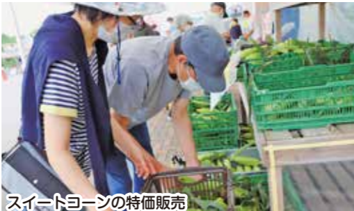
スイートコーンの特価販売

森基幹支店と同地区青年部は8月21日、森町で開かれた「三業まつり」に出店し、多くの来場客で賑わいました。地場産野菜の即売会ではトマトやスイートコーン、ブルーベリーなどを販売した他、カボチャのばら売りや馬鈴薯の詰め放題を行いました。また、カボチャや馬鈴薯、スイートコーンが当たるクジ付きの牛乳を販売するブースも出店され、約20分で完売。青年部は、正解者に地場産野菜をプレゼントする野菜重量当てゲームを行い、家族連れの来場客で賑わいました。