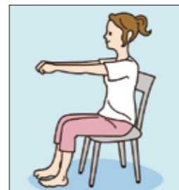
(2) 両腕をグーにして伸ばし、両足は指の関節をしっかり曲げ、そろえて前に出してグーのポーズを取ります。