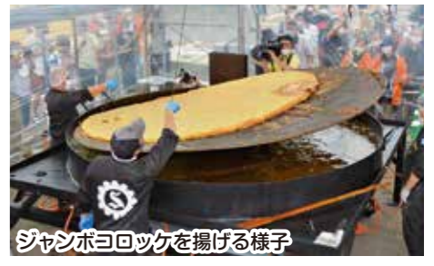
ジャンボコロケを揚げる様子

南桧山地区青年部は7月23日、厚沢部町で開かれた「ふるさと夏まつり」にて即売会を行いました。本即売会では、あっさぶメーカーや地場産ふっくりんこ、アスパラ、ブロッコリーを限定特価で販売し、新鮮な味を求め多くの来場客が訪れました。また、毎年恒例のメインイベントであるジャンボコロケ作りでは、約1300人分、直径2.6メートル、重さ279キロのジャンボコロケが作られ、ギネス世界記録に認定されました。コロケの原料には、同地区青年部が厚沢部町認定こども園はせるの園児らと植えた「メーカーイン」などを使用。ギネス認定には完食が条件で、町内外から集まった1000人以上の来場客がジャンボコロケを堪能しました。