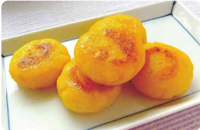
※写真は盛り付け例