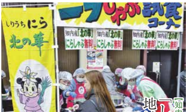
知内女性部応援のもと、ニラしゃぶを無償提供する様子