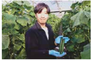
きゅうりとトマトはそのまま食べるのが一番と教えてくれました。

「就農までの経緯についてお聞かせください」 地元の森高等学校を卒業後、本州で数年間働き、その後地元に戻りました。実家が農家だったこともあり、25歳の時に就農しました。幼い頃から家の手伝いで農作業に関わっていたため、ある程度の知識はありましたが、小さい頃は自分の意志でやっていたわけではありませんでした。なので、改めて農業の現場で1から学び直そうと思いました。 「農業を始めて苦労したことはありませんか？」 就農直後に父が入院し、自分が作業を担うことになりました。1年で2作行っていることや、知識不足などもあり温度管理や水管理などとても苦労しましたが、周りの方々から教えてもらいながら、何とか乗り越えることができました。 「農業をしていてやりがいを感じる瞬間を教えてください」 同じ面積で前年よりも収量が増えたときに、やりがいを感じます。昨年の自分と競い合っているような感覚があり、自分の成長を実感できる瞬間です。 「仕事をやる上で大切にしていることはありますか？」 分からないことはそのままにせず、必ず調べたり周りの人に聞いたりするようにしています。周囲には知識や経験が豊富な方が多いので、焦らず自分のペースで着実に取り組むことを大切にしています。 「今後の展望についてお聞かせください」 人手が確保できれば、トマトの栽培規模をさらに拡大していきたいと考えています。近年は人手不足で作付面積が減少していますが、収量を落とさずに規模を広げていくことが目標です。