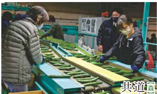
道内一早く始まった地熱きゅうり共選(北斗市で)