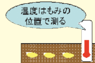
育苗管理のポイント

温度測定は出芽揃まで地温が分かる種籾の位置、出芽揃後は葉先の高さに温度計を設置し、苗の生育に合わせた温度管理をしましょう。