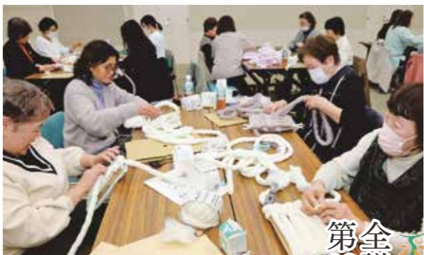
「マンドゥバッグ」作りを行う部員たち