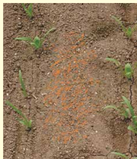
写真 藻類が発生したほ場(オレンジの部位)