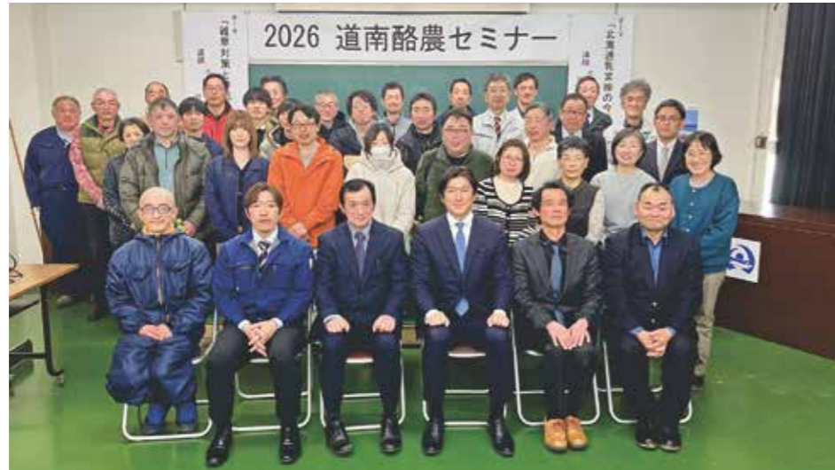
道南酪農セミナーに参加した生産者と関係者のみなさま

セミナーを通じ、生産者からは協力的な意見が相次ぎ、増産に向けた機運が大きく高まりました。JAとしても、この機運を組織全体で共有し、生産者組織と連携して地域酪農の発展に向けた取り組みをより一層加速させてまいります。